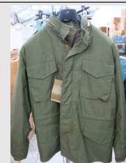
Field Jacket M65 H.P.S.